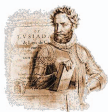
Rota de Camões

Inscrição gratuita / obrigatória: turismo@cm-constancia.pt 249 730 052